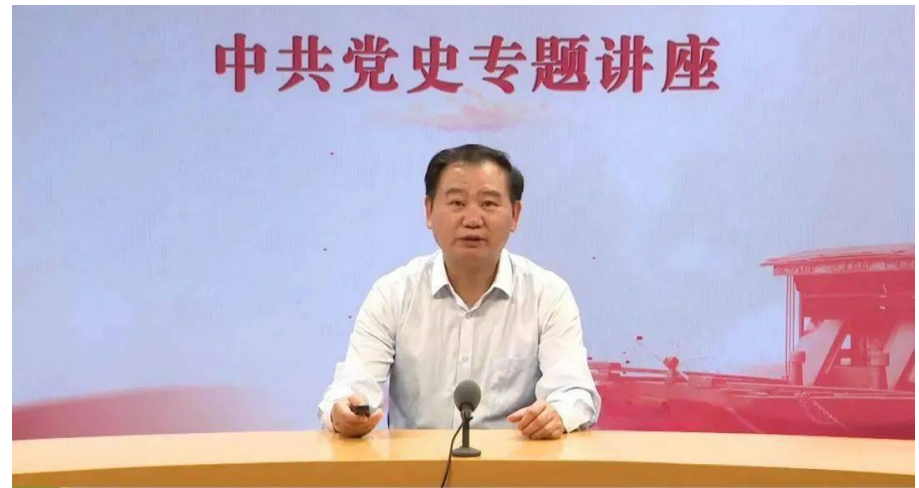
（聆听党史专题讲座）

常态化集中学习教育。会上，集中学习了《中国共产党简史》第四章“夺取新民主主义革命的全国胜利”和第五章“中华人民共和国的成立与社会主义制度的建立”的相关内容并继续发挥各类学习平台作用，积极开展微党课学习，观看了中共党史专题讲座《朱毛红军与古田会议》。